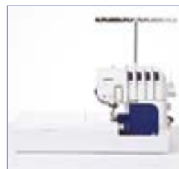
Tavolo di prolunga