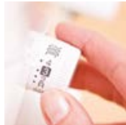
Regolazione della lunghezza del punto