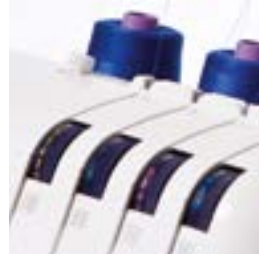
Facile guida all' infilatura con quattro colori