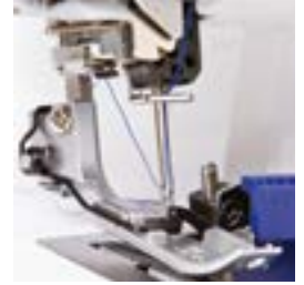
Infilatore automatico degli aghi