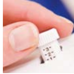
Regolazione della pressione del piedino