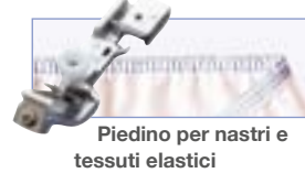
Piedino per nastri e tessuti elastici